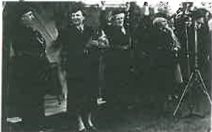
8500 padvindsters brengen op de Jubeldag Een groet aan koningin Juliana

De Edese scouts nemen actief deel aan allerlei landelijke en internationale Scoutingactiviteiten. Na de Tweede Wereldoorlog wordt de draad weer opgepakt voor het organiseren van Wereldjamborees. Naar de eerste naoorlogse Wereldjamboree in Moisson, Frankrijk (1947), worden twee Bennekomse verkenneren afgevaardigd. Het hiervoor benodigde bedrag (f 200,00 p.p.) is door de hele troep verdiend. Er worden ruim 4.000 lege flessen ingezameld voor het statiegeld. Ter gelegenheid van het 40-jarig bestaan van Scouting in Nederland wordt in 1959 in Ommen een Nationaal Kamp gehouden. Hieraan nemen 7.000 padvindsters uit binnen- en buitenland deel. Bennekom is met 22 man vertegenwoordigd. Ook de andere groepen uit de gemeente Ede doen mee. Het kamp wordt op 2 augustus officieel geopend door H.M. Koningin Juliana. Voor de welpen wordt in Utrecht een grote Rimboejacht gehouden. Voor de meisjes van het NPG, het Nederlandse Padvindsters Gilde, is 1951 een feestjaar. Het 35-jarig bestaan werd groots gevierd op de Jubeldag. 8.500 padvindsters komen naar de Goudsberg in Lunteren. Eregast was Koningin Juliana.