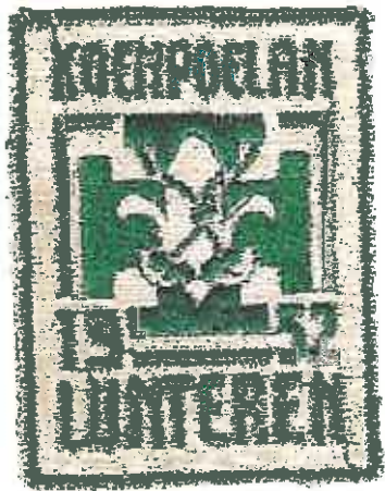
Badge van de landelijke Koempoelan in Lunteren

Na de Tweede Wereldoorlog worden ook verschillende landelijke Scoutingactiviteiten in Lunteren georganiseerd. De Goudsberg wordt aangekocht door de Nationale Padvindersraad (NPR). Op 30 juni 1946 houden de leiders van de Katholieke padvindersbeweging (VKJB) hier hun jaarlijkse bijeenkomst, de Koempoelan .