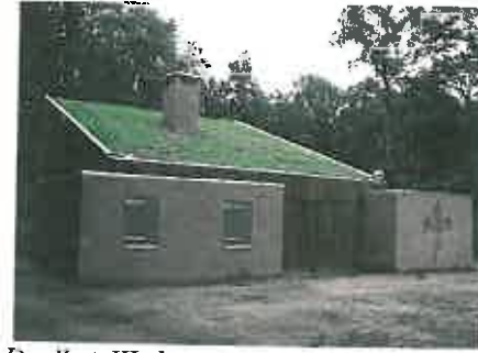
Doothut III, het nieuwe clubhuis van de Pieter Maritzgroep

Dit jaar is sowieso een feestjaar, omdat Scouting 100 jaar in Nederland bestaat. En dat wordt groots gevierd.