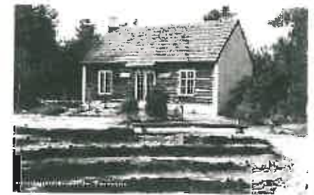
Het gebouw HOGAN van de Musingagroep.

Na een toespraak trekt hij een vlag weg en onthult daarmee de naam HOGAN (Indiëans voor "vaste verblijfplaats").