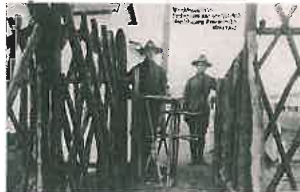
Padvinders bij de hoofdingang van Vluchtoord Ede.

In 1908 verschijnt in Engeland het boek Scouting for boys , geschreven door Robert Baden Powell, een generaal uit het Engelse leger. Het boek bevat een mengeling van sterke verhalen, kampeer- en spoorzoekersvaardigheden, tips en trucs, en aanwijzingen voor begeleiders. Met dit boekje in de hand beginnen overal in Engeland jongens (en ook meisjes) met het spel van verkennen. In 1907 organiseert BP een kamp op Brownsea Island om zijn ideeën voor de vorming van de jeugd uit te testen. Hiermee wordt de basis gelegd voor een wereldwijde beweging met nu meer dan 40 miljoen leden in ruim 160 landen.