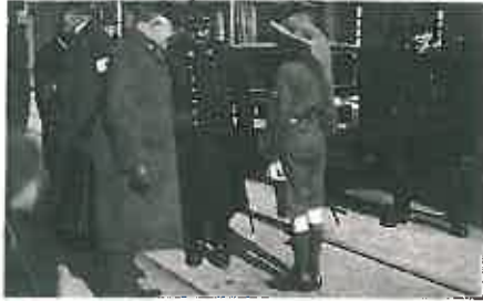
Prins Hendrik met een padvinder bij de opening van het Johannierter Ziekenhuis

vreselijk gat en 't lijkt me voor die duizenden soldaten die daar gevestigd zijn een ware hel toe... " Over hoe het in de jaren na de Eerste Wereldoorlog verder met de padvinderij in Ede gaat is weinig bekend. Op een foto van het bezoek van Prins Hendrik, aan de opening van het uitgebreide Johannierter ziekenhuis in Bennekom in 1927 staat echter een padvinder.