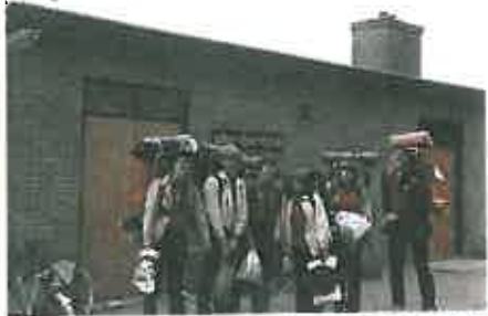
Rowans van de Tarcisiusgroep voor De Brink

het gemeentelijk bosbedrijf op de Ginkel gemaakt. De tijden zijn veranderd, gemeente en rijk dragen ruimschoots bij in de kosten. Een verloting van duizend loten à f 30,- maakt het kostbare plan financieel rond. De hoofdprijs is een Fiat 850. De bouw zal een veeljarenplan worden. Omdat het oude troeophuis is gesloopt, gaan de welpen tijdelijk naar een pand aan de Torrenstraat en later naar een schuur aan de Langenberglaan.