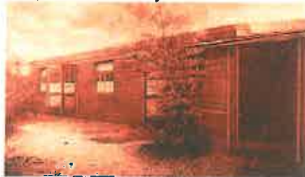
Het 'schoolreisjesverblijf' achter café De Langenberg dat onder meer diende als troepluis voor de padvindsters van de Edese Langenberggroep.