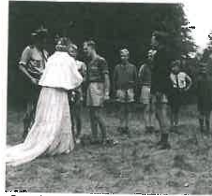
Bezoek van de heidekoningin aan het zomerkamp met de kinderen uit Strijen.

In juli wordt het gebouw de Kromschutte door de Rotterdammers in gebruik worden genomen. De Rotterdammers huurden de gebouwen van 15 juni tot 1 september.