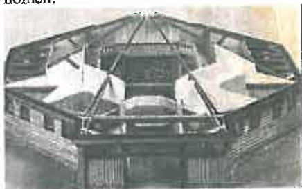
Het nieuwe clubhuis van de Langenberggroep

Op 21 september 1974 komen de eerste kabouters en padvindsters bij de Langenberggroep. Ze zijn afkomstig van de 22-2 groep , een fusie tussen de Wintapgroep en de Rohdagroep . De 22-2 groep heeft geen groepshuis en maakt gebruik van het nieuwe troeophuis van de Langenberggroep, dat bijna gereed is. Op 1 januari 1975 worden ze formeel in de groep opgenomen.