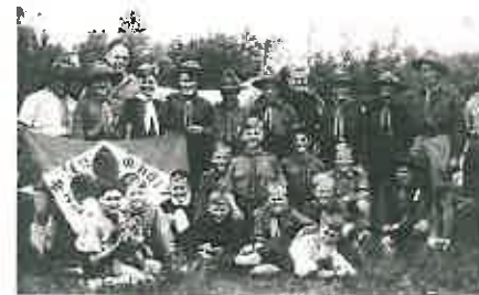
Groepsfoto van de Pieter Maritzgroep tijdens het zomerkamp in 1948.

Al snel wordt de padvinderij in het dorp Ede té populair: Er zijn te veel jongens die padvinder willen worden en te weinig mensen die hen als leiding kunnen opvangen. Op zoek naar nieuwe leiding komt de Langenberggroep in contact met de heer Van Klaveren. Hij heeft vóór de oorlog bij een christelijke padvindstersgroep in Utrecht gezeten.