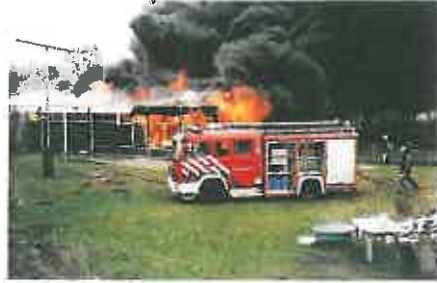
Brand in het gebouw van de Jan Hilgersgroep in 2001

wijze in gebruik genomen als nieuw onderkomen van de groep.