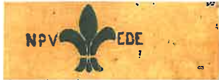
De armband die na de oorlog werd gedragen

Na de bevrijding van Ede op 17 april 1945 blijkt dat de padvinderij nog springlevend is. Padvindsters verlenen hand- en spandiensten aan het nieuwe gezag. Vaak in incomplete en te krappe uniformen of met enkel een armband NVP-Ede .