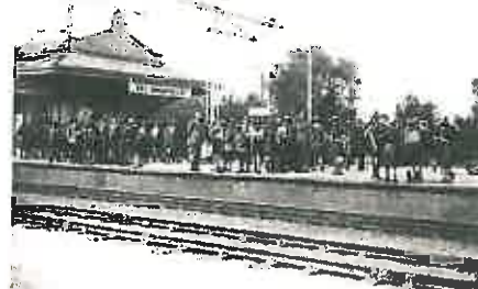
Vertrek van de Schotten bij Station Ede-Wageningen. Foto: Gemeente Archief Ede (G.110986)

Ondertussen is op 6 januari 1931 in Ede ook de Sint Tarcisiusgroep gestart. Het is een katholieke jongensgroep, genoemd naar een heilige martelaar. De groep kiest voor een das met de pauselijke kleuren geel en wit. Al snel wordt dit lichtgrijs met geel, omdat wit wel heel licht is. Na een paar jaar wordt de das gewisseld met een Schotse ruit, omdat deze veel minder besmettelijk blijkt. Voor katholieke padvindsters is een jaar eerder de Vereeniging der Katholieke Verkenners (KV) opgericht, omdat in die tijd katholieke jongens zich niet zo maar mochten aansluiten bij een neutrale vereniging als de NPV.