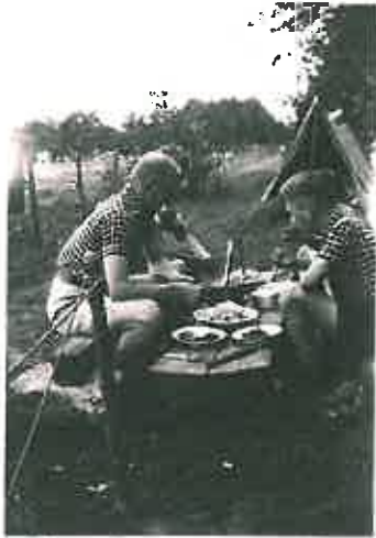
Illegaal kamp in Achterberg.

Het in beslag genomen troephuis van de Langenberggroep doet in de oorlog aanvankelijk dienst als clubgebouw van de NSB-jeugdstorm, daarna als paardenstal. De laatste Oorlogswinter worden de golfplaten door de Duitsers gebruikt bij de stellingbouw. Door de brandstofschaarste wordt een groot deel van het gebouw gesloopt. Aan het eind van de oorlog staan alleen nog een paar wanden overeind.